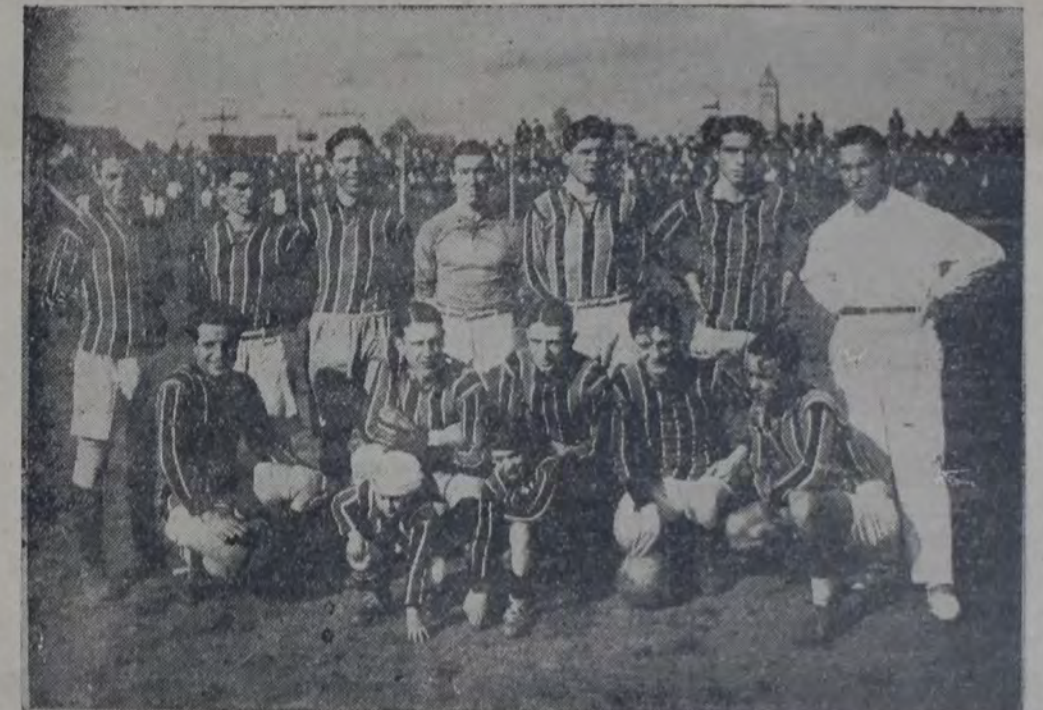
CONJUNTO DE CHACARITA JUNIORS, QUE EN REÍDA LUCHA PERDIO AYER EN SU COTEJO CON Sportivo Barracas.

doce su valla de una caída al encontrarse a un costado y fuera del arco, pues detuvo un tiro corto de Fernández con cierta inseguridad; la pelota se le escapó de las manos y si no se