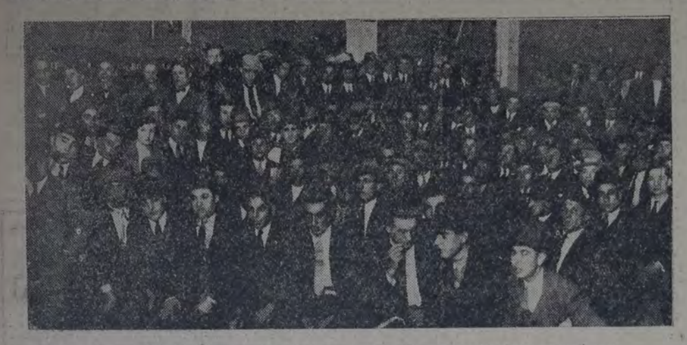
VISTA DE LA ASAMBLEA REALIZADA AYER EN EL LOCAL MONTES DE OCA 1683.