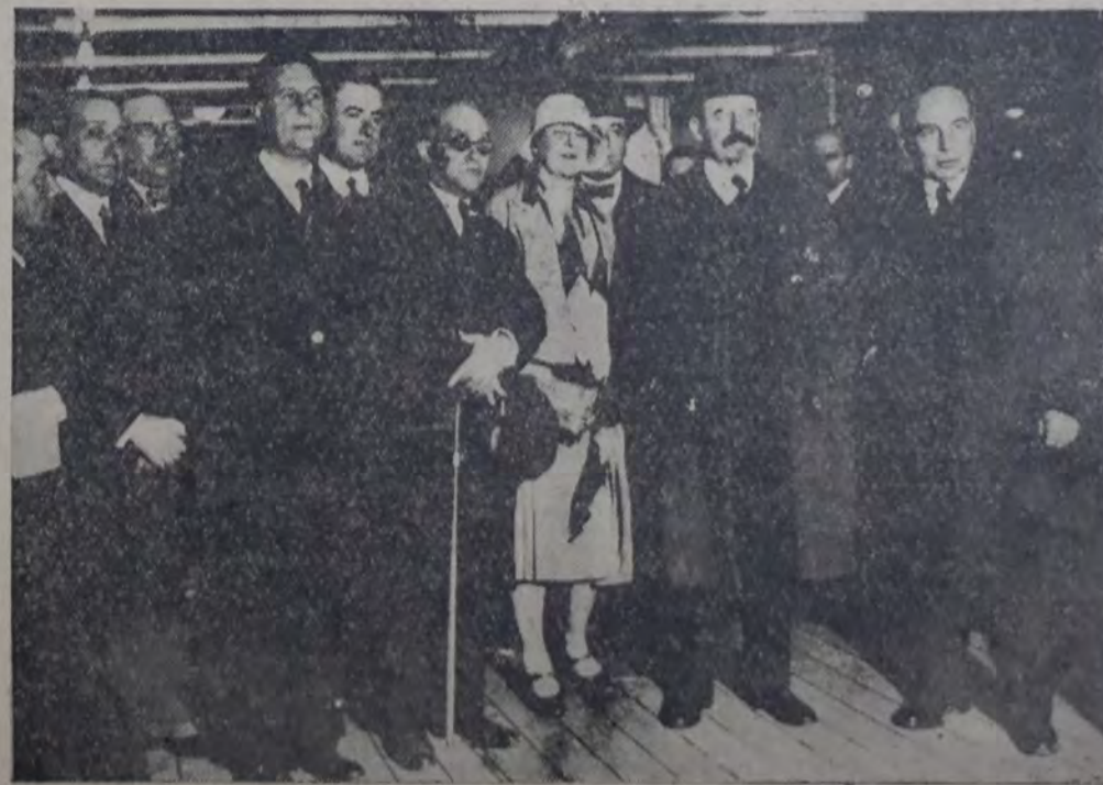
UN GRUPO DE COMPAÑEROS SOCIALISTAS rodeando a VANDERVELDE y a LA DOCTORA BEECKAN, anoche, poco después de su llegada.

El fondo de seguros de la compañía accionada en el último balance a 233.000 libras esterlinas. En 1927 el número de las embarcaciones aumentaron de 259 a