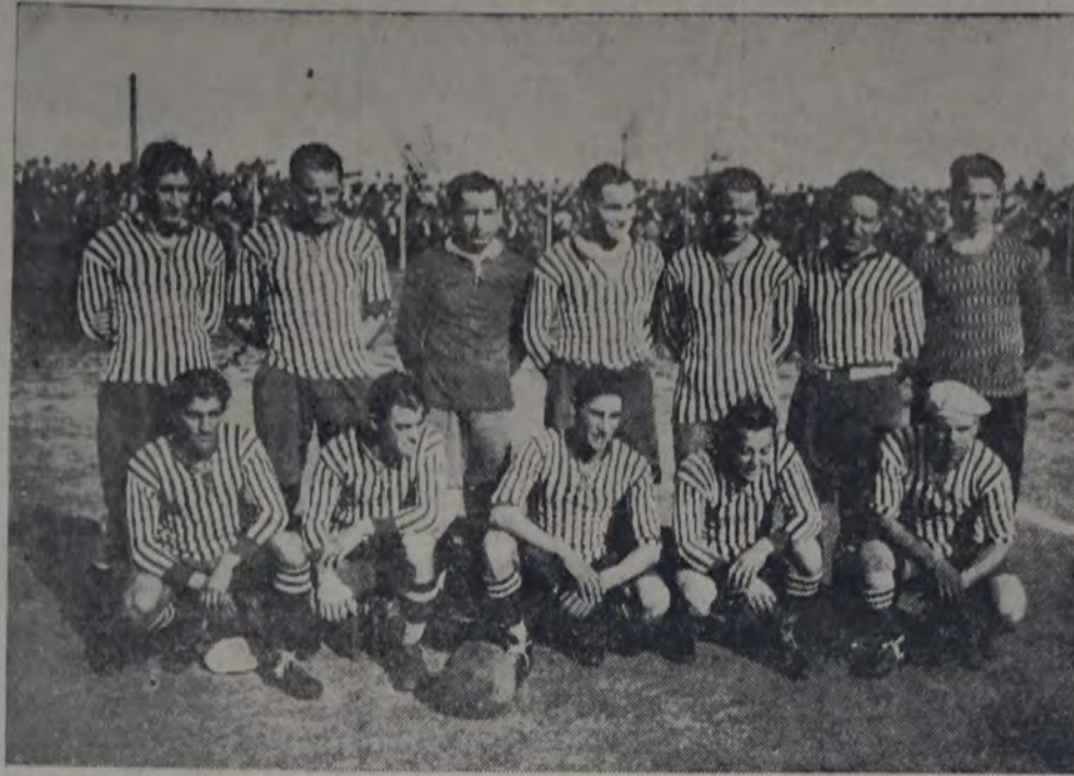
EQUIPO DE SPORTIVO BARRACAS, CUYA ALA IZQUIERDA ACTUO AYER EN GRAN FORMA FRENTE A Chacarita Juniors, a quien venció por 4 a 2.