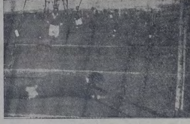
1. BATZ APROVECHO UNA SALIDA EN FALSO DEL ARQUERO DE ATLANTA PARA MARCAR EL UNICO TANTO QUE OBTUVO SP. PALERMO en el partido que este último perdió ayer. — 2. Otra situación de apremio frente a la ciudadanía de Atlanta.