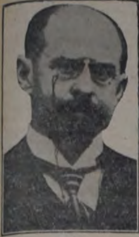
EL CAMARADA EMILIO VANDERVELDE, que arribó ayer a Buenos Aires.